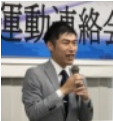
▲山添 拓 参議院議員